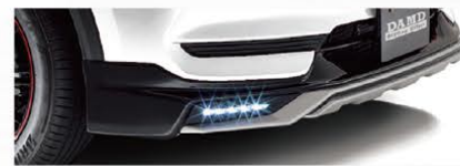
DAMD フロントアンダーガーニッシュ 101,530円(消費税込)

CX-5本来の美しいボディラインを活かしながら、メリハリある立体造形と ブラック&シルバーのコントラストによって、アグレッシブなスポーツSUVへと変貌させます。