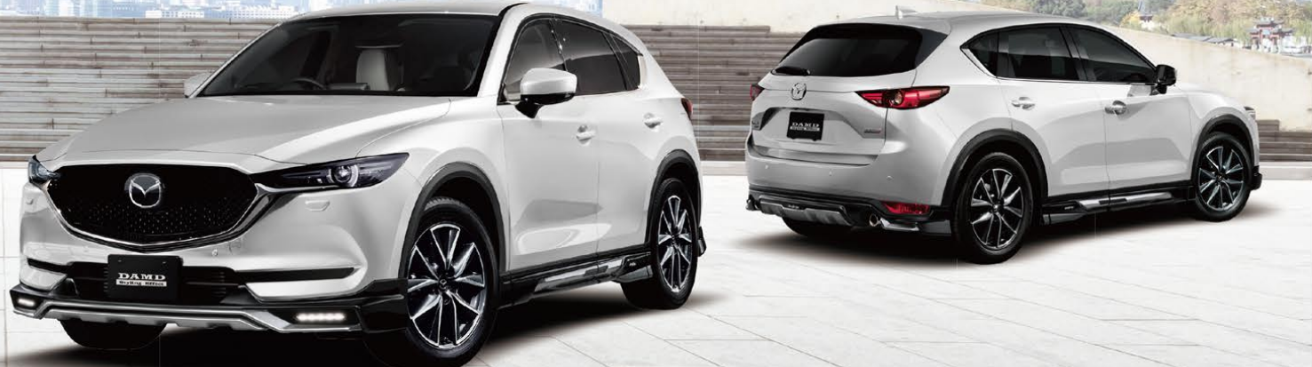
Body Color : スノーフレイクホワイトパールマイカ(特別塗装色)

※限界プライスのため、“きゅんです”パッケージは対象外となります。※スノーフレイクホワイトパールマイカ33,000円(消費税込)が含まれた価格となります。※他のボディカラーをご希望の場合は営業スタッフにお問い合わせください。