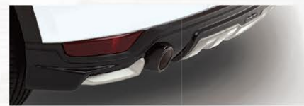
DAMD リアアンダーガーニッシュ 79,200円(消費税込)

オプション装着合計価格278,960円(消費税込) + 車両本体価格3,553,000円(特別塗装色含む/消費税込) = 合計3,831,960円(消費税込)のところ