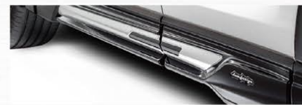
DAMD サイドアンダーガーニッシュ 98,230円(消費税込)